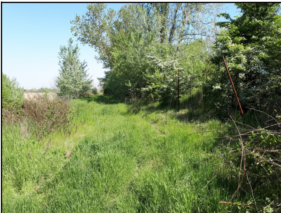
📍 Foto 7: Fascia perimetrale a piano campagna del Lato est di Cava Trinelli con ripresa verso nord. Si noti la vegetazione arboreo-arbustiva perimetrale a cavallo del confine con l'area demaniale a ridosso del muraglione