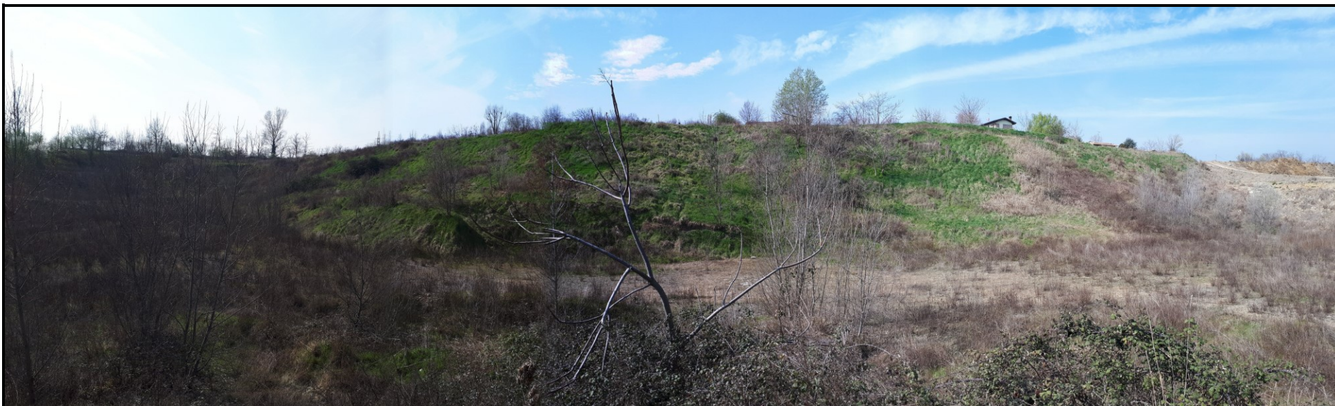
📍 Foto 5: Scarpata Ovest di Cava Trinelli, risagomata a seguito del collaudo del settore sud-ovest ripristinato a piano campagna