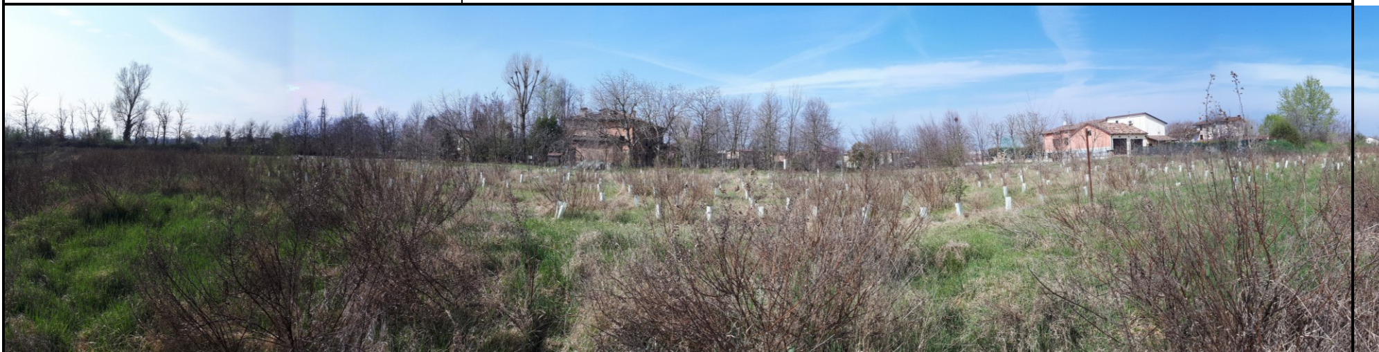
📍 Foto 6: Confine sud-ovest di cava Trinelli . Immagine dell'avvenuto ripristino a piano campagna con la piantumazione del map. 134 fg. 26 collaudato Sul lato sx della foto si noti la vegetazione arboreo-arbustiva esistente sul confine