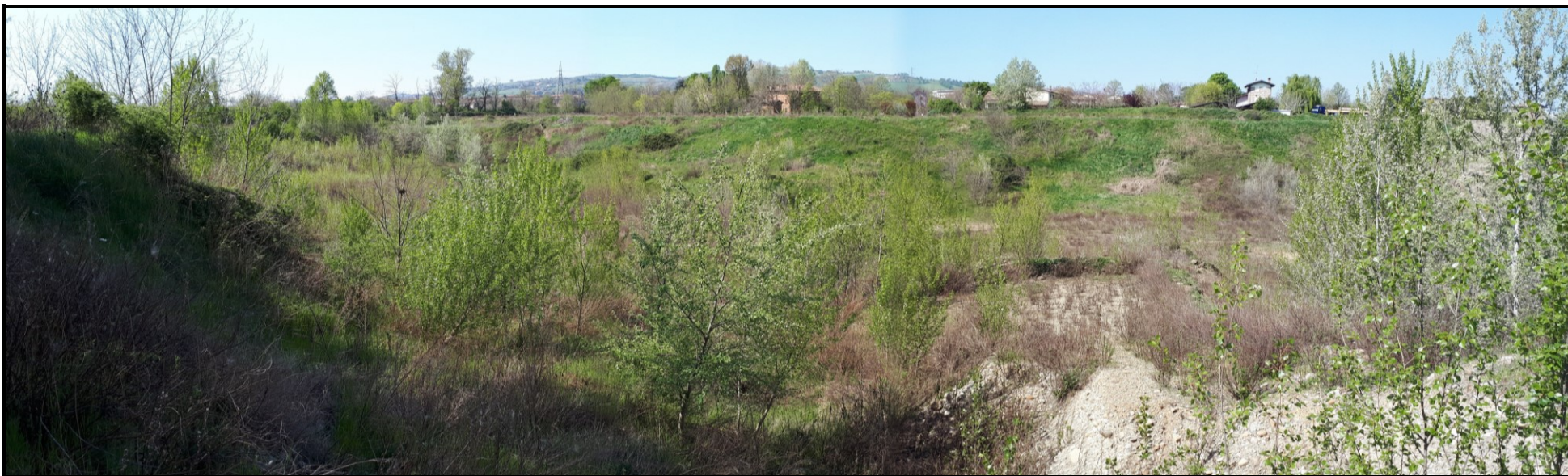
📍 Foto 1: Panoramica della scarpata ovest dell'area di cava Trinelli ripresa dall'ingresso. Si noti la fossa di cava caratterizzata da un ampio rinverdimento spontaneo