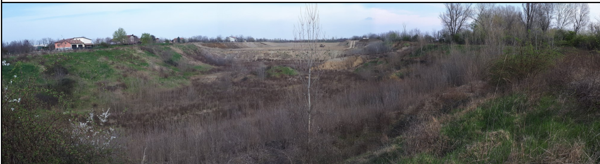
📍 Foto 2: Panoramica dell'area di cava Trinelli dal lato sud verso Nord Si noti la morfologia a piano ribassato, il cumulo del cappellaccio residuo sul fondo cava, la scarpata di confine con l'adiacente cava La Noce in corso di ripristino