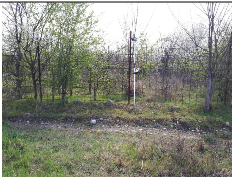
📍 Foto 8: Fascia perimetrale a piano campagna del Lato sud di Cava Trinelli. Si noti la vegetazione arboreo-arbustiva perimetrale esistente a cavallo della recinzione e la presenza di una debole discontinuità morfologica legata all'avvenuta decorticazione del cappellaccio da ripristinare